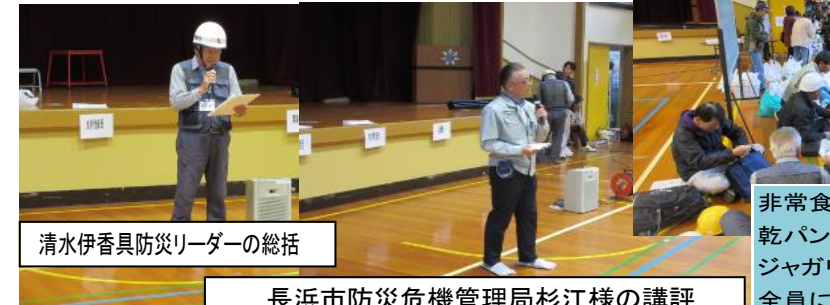
清水伊香具防災リーダーの総括