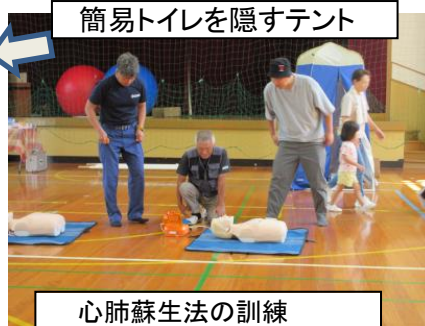
心肺蘇生法の訓練