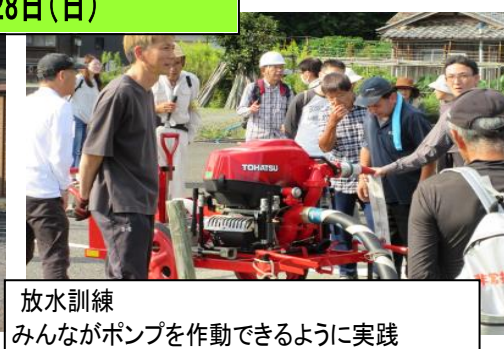
放水訓練 みんながポンプを作動できるように実践