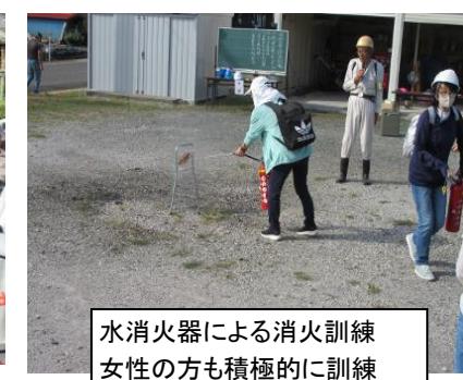
水消火器による消火訓練 女性の方も積極的に訓練