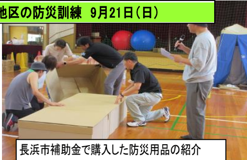
長浜市補助金で購入した防災用品の紹介 段ボールベッドの組み立て風景