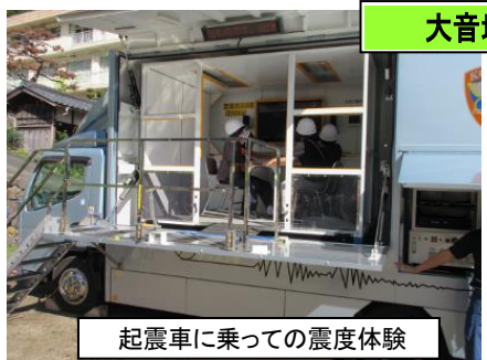
起震車に乗っての震度体験