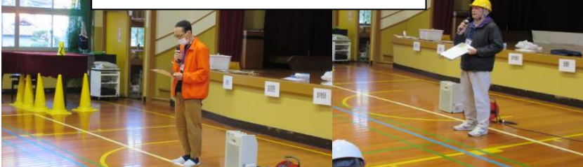
坂木連合自治会長(本部長)の開会の挨拶