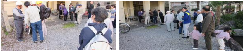
防疫の重要性のため、一次受付と二次(総合)受付の実施