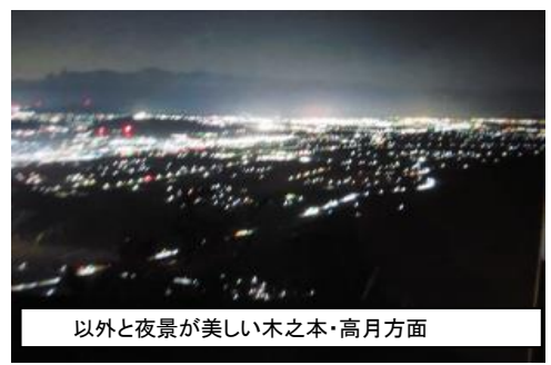
以外と夜景が美しい木之本・高月方面

残念ながら曇り空で月は見られませんが、花火と夜景は素晴らしいものでした。リフト無料のご厚意もあり、リフト利用での参加者は248名。なんと夜間での徒歩参加者が13名もありました。計261名の方が参加していただき大変ありがとうございました。