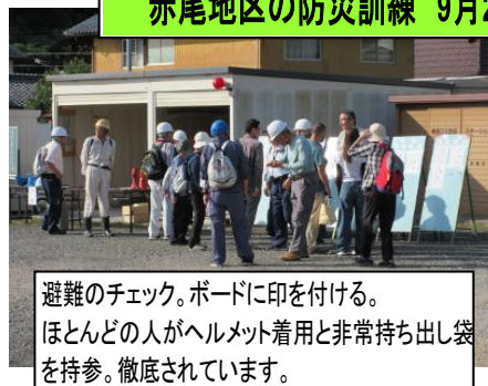
避難のチェック。ボードに印を付ける。 ほとんどの人がヘルメット着用と非常持ち出し袋 を持参。徹底されています。